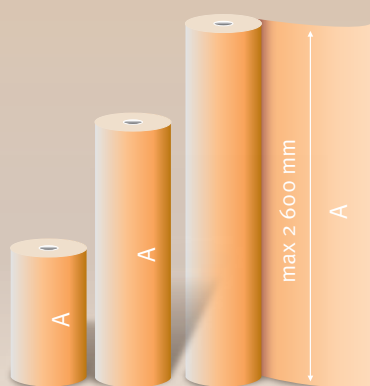
ROLE “NA MÍRU” šíře 50–2600 mm, váha 70 kg